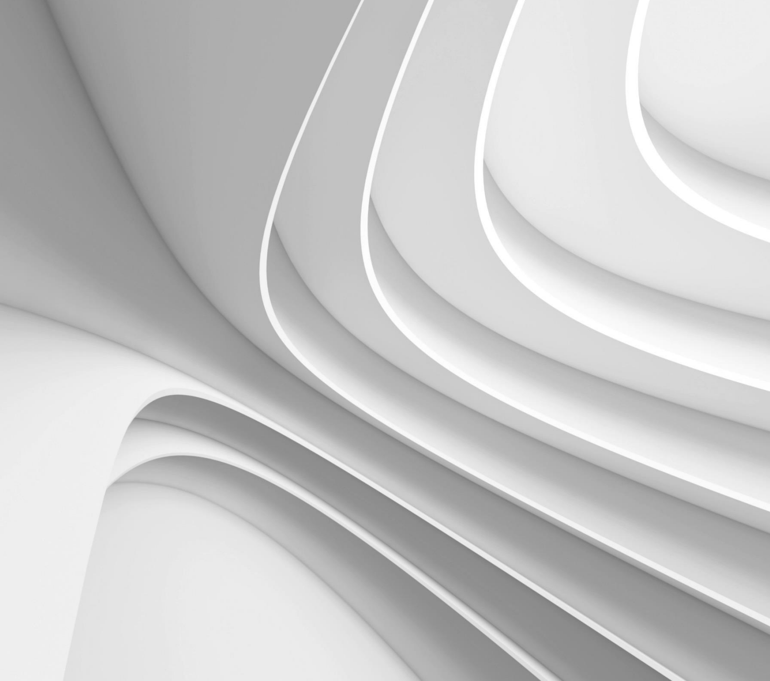
ABB EN CHILE, RA Robotics, 20 de marzo de 2020